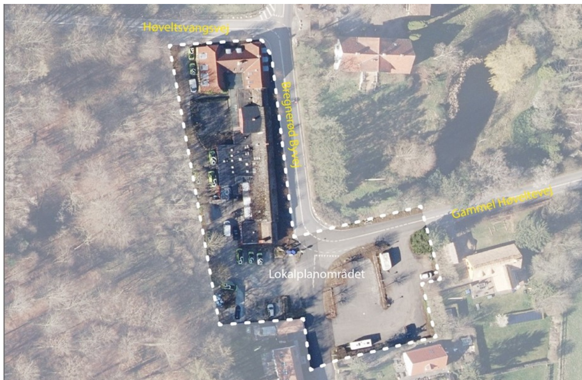
Afgrænsning af kommuneplanramme 20F12 - Hotellejligheder i Bregnerød, som er samme afgrænsning som Lokalplan 159

I henhold til Lov om planlægning ændres kommuneplanens bestemmelser for lokalplanlægningen for Rammeområde 20B2 Bregnerød Landsby nord. Kommuneplantillægget er tilvejebragt sammen med Lokalplan 159 for Bregnerød Kro.