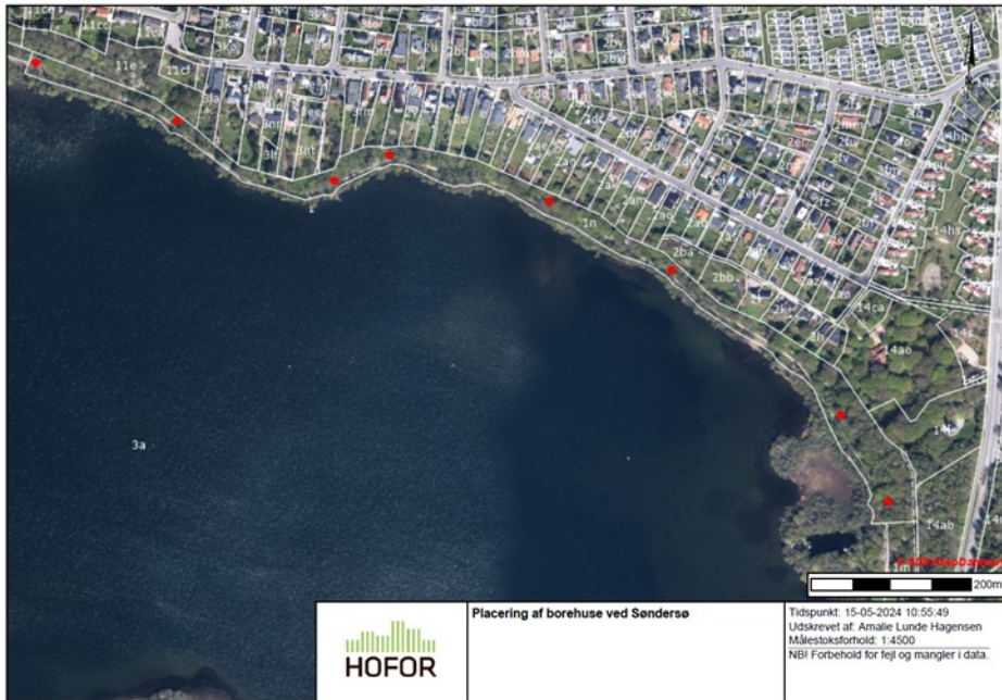
Figur 1 kortoversigt over placeringen af de otte borehuse ved Sønderlø