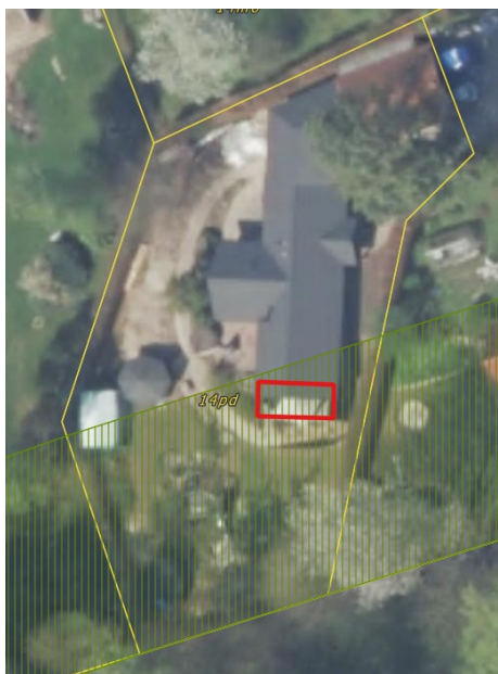
Figur 2: Omtrentlig placering af kælderudvidelsen (Kort udarbejde af kommunen)